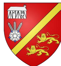
Mairie de Rougemontier