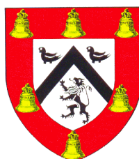
Mairie de Corneville Sur Risle